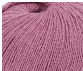
☛ gr 450 colore cod. 957