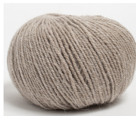
• gr 350 colore cod. 309