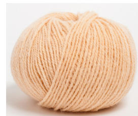
• gr 250 colore cod. 302

Scopri le caratteristiche del filato "ANDES" nel box "Filato"