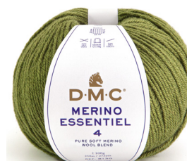
☛ gr 500 colore cod. 874