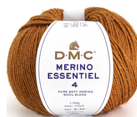
☛ gr 500 colore cod. 876

Scopri le caratteristiche del filato "MERINO ESSENTIEL 4" nel box "Filato"